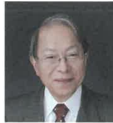
静岡大学名誉教授 徳川みらい学会会長

著書に『自分を守る経済学』(ちくま新書)、『マルクスを読み直す』(筑摩選書)。訳書に『豊かさの誕生』(日本経済新聞出版社)など。