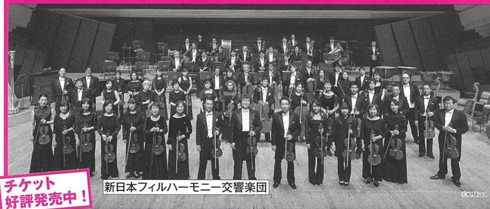
新日本フィルハーモニー交響楽団