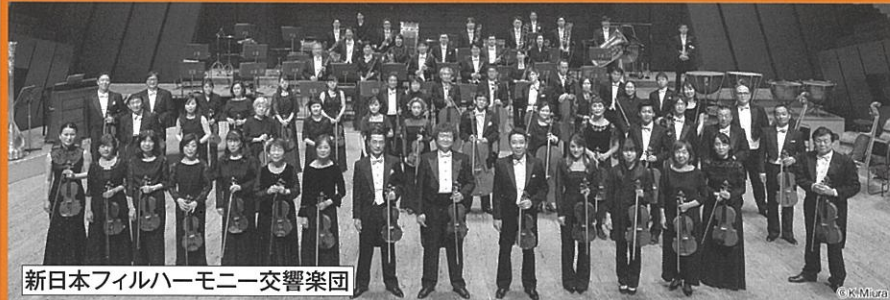
新日本フィルハーモニー交響楽団