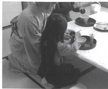
これまでの作法教室の様子

令和5年 8月20日 (日) 10:30~14:00 甲山閣 (岡崎市六供町甲越6番地21)