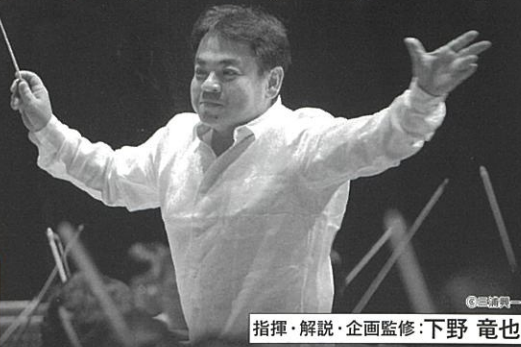
指揮・解説・企画監修: 下野 竜也

大河ドラマ 1963年~2023年までの全62作の どの作品が演奏されるかお楽しみに!