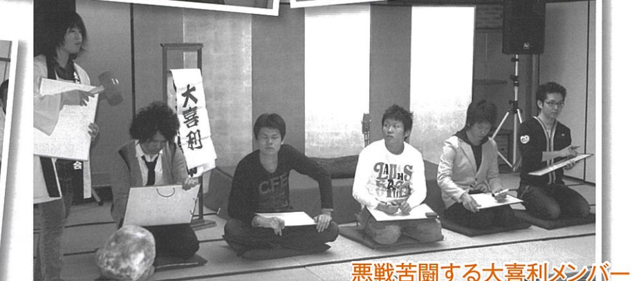
悪戦苦闘する大喜利メンバー