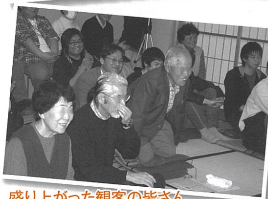
盛り上がった観客の皆さん